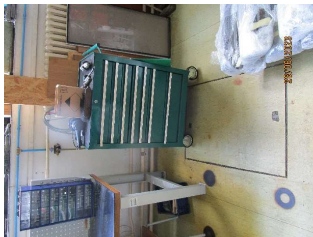
UL 003 – pohled na podlahu