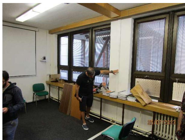
UK 113 – pohled do místnosti