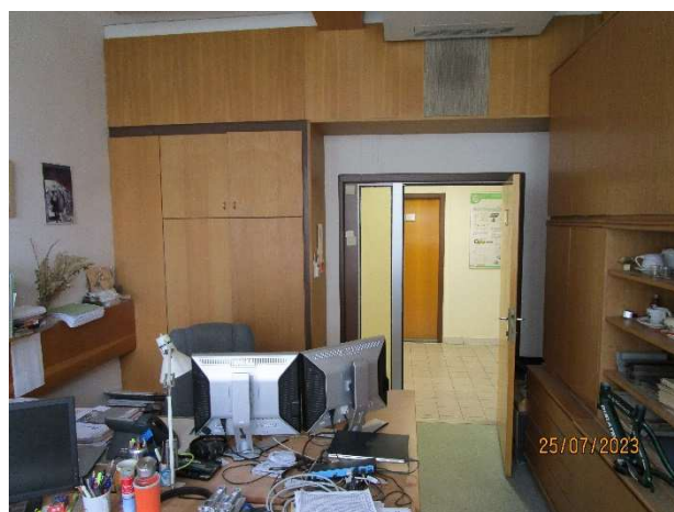
UK 118 – nábytková sestava + zákryt