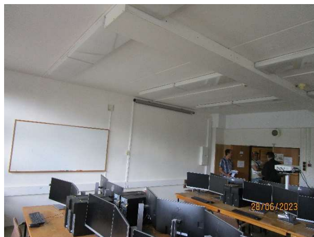
UL 107 – pohled do místnosti