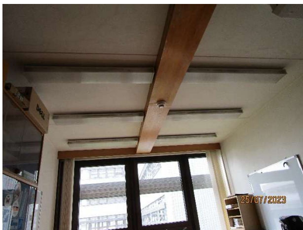
UK 110 – pohled strop