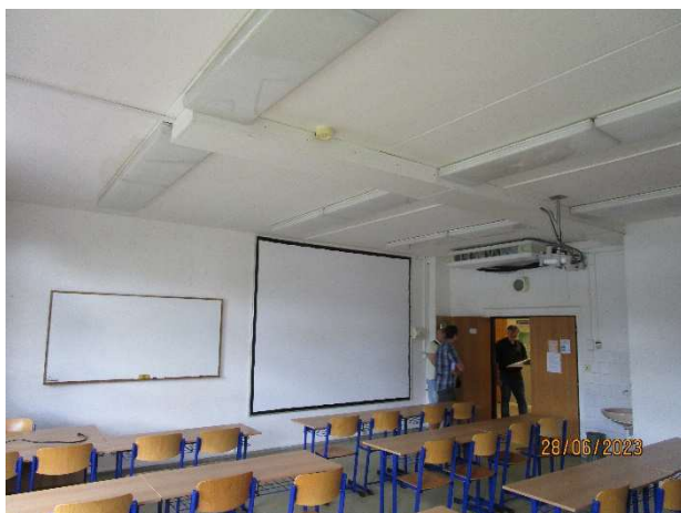
UL 103 – pohled do místnosti