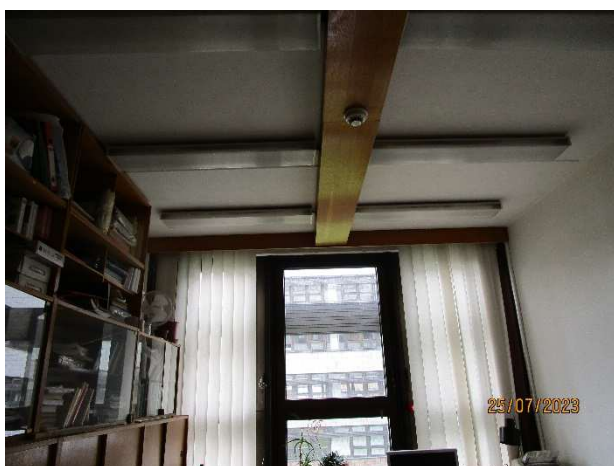
UK 114 – pohled do místnosti + strop