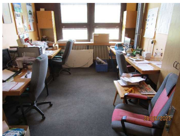
UL 101b – pohled do místnosti