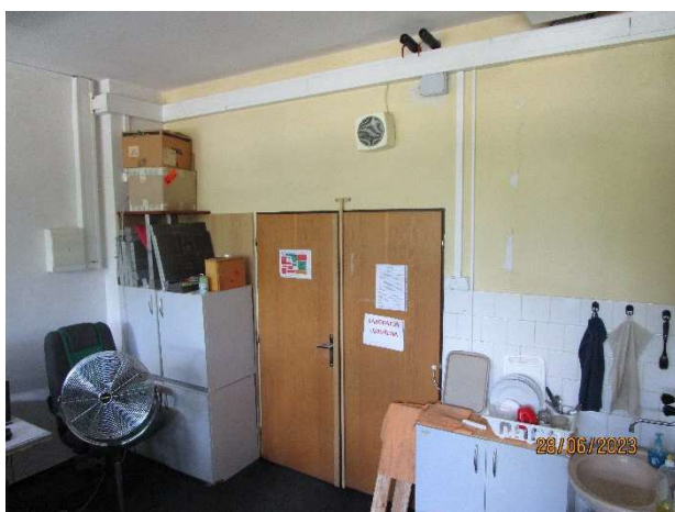
UL 111 – pohled na vstupní dveře