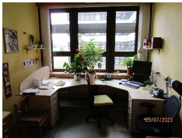
UK 112 – pohled do místnosti